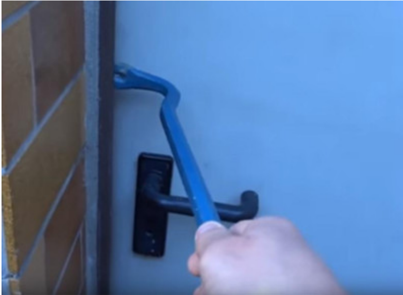
Abbildung 1 - Einbruch