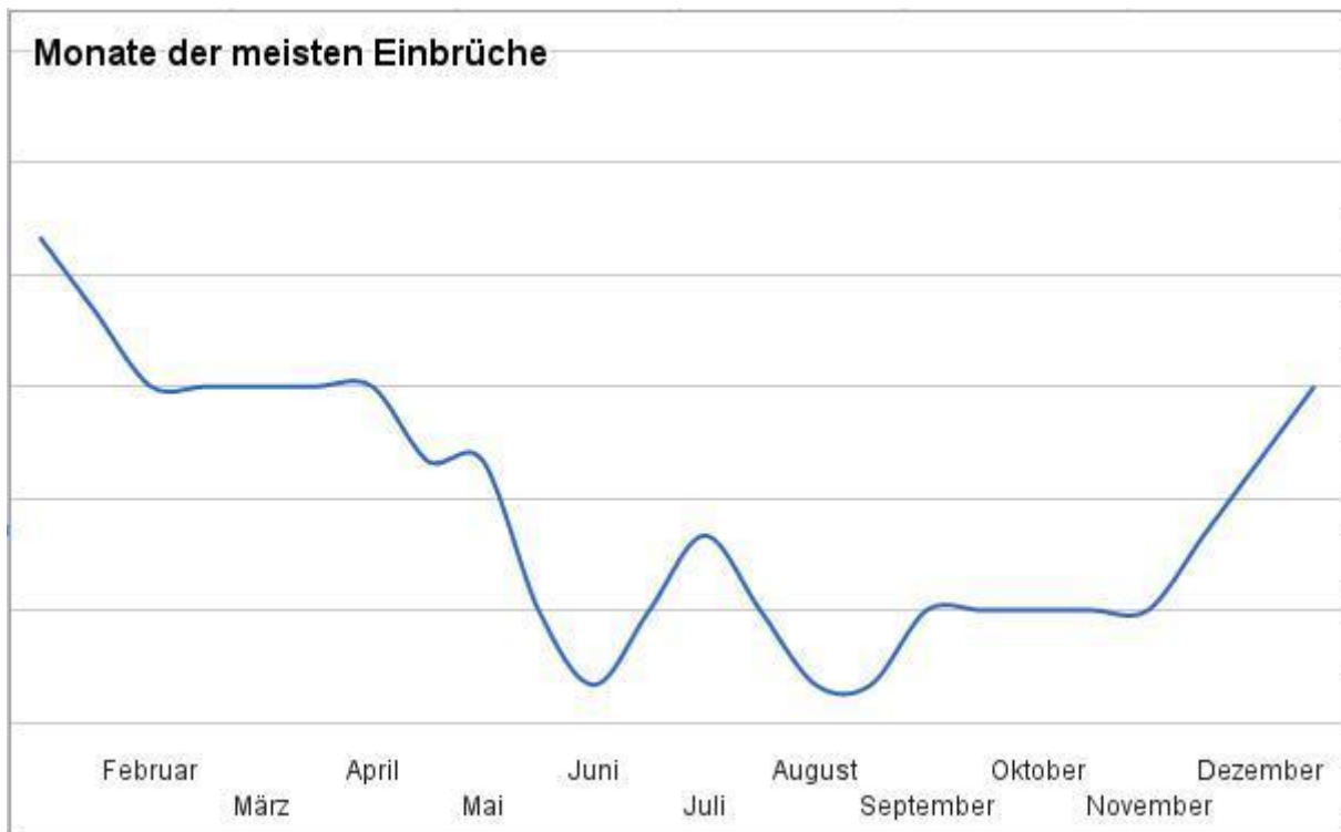
Abbildung 2 - Monatsübersicht Einbrüche