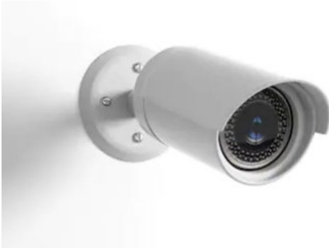
Abbildung 4 - Feststehende Kamera

zur Überwachung von Zugängen, Plätzen, Geländegrenzen usw.