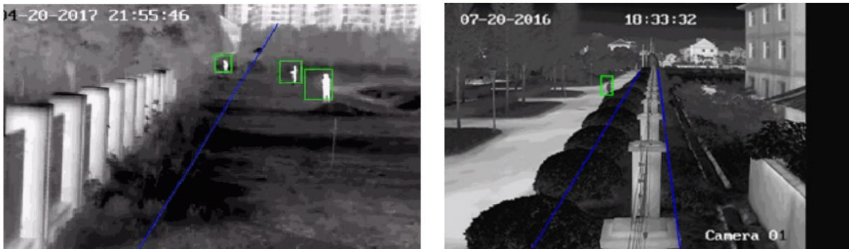
Abbildung 2 - Ultradetection

Security Intelligence unterstützt Sie in der Prävention und Aufklärung von Einbrüchen, Überfällen, Diebstählen und anderen strafrelevanten Themen. In einem Einbruchfall kann die Dienstleistung eine Alarmnachricht oder ein Signal senden. Die Aufzeichnungen werden für eine von Ihnen bestimmte Dauer geschützt und in der padcom Cloud in einem FINMA konformen Rechenzentrum in Zürich sicher gespeichert. Dies ist Optional erhältlich.