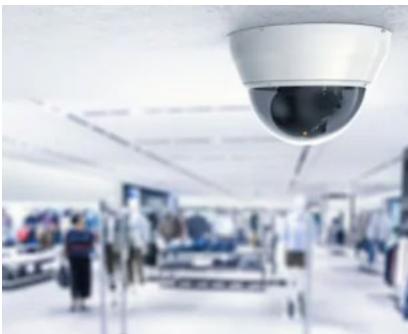
Abbildung 5 - Domekamera

für virtuelle Rundgänge, Täterverfolgung und heranzoomen bei besonderen Ereignissen