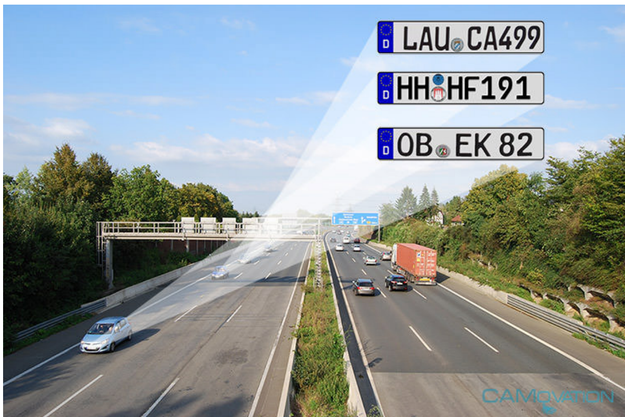
Abbildung 3 - Nummernschilderkennung