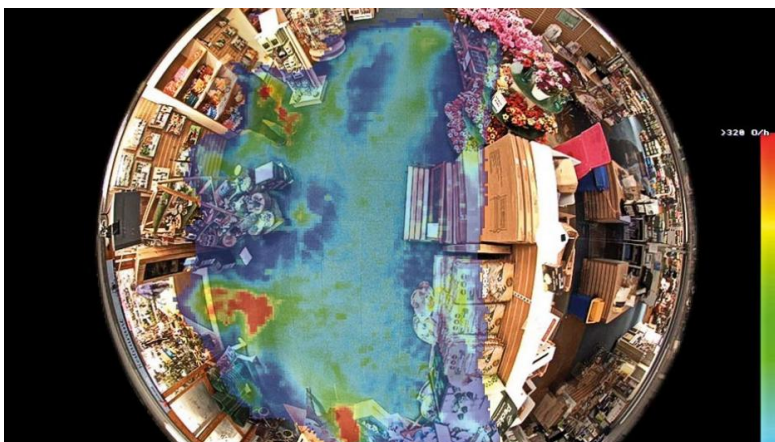
Abbildung 1 - Besucherzahl Detailhandel

Business Intelligence analysiert anhand von Videodaten und anderen Quellen geschäftsrelevante Kennzahlen (KPI). Die Dienstleistung kann insbesondere Besucher, Objekte zählen, Besucher nach Geschlecht und Alter erfassen und ihre Verweildauer messen. Dadurch erhalten Sie wichtige Erkenntnisse über Ihre Kunden und deren Verhalten, und Sie können Ihr Kerngeschäft effizienter gestalten.